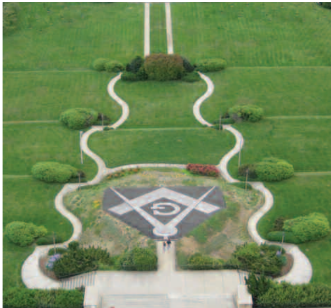
Jardins du George Washington Masonic National Memorial