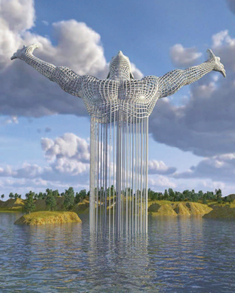
Transcendence des voies sacrées Sculpture monumentale de Chad Knight