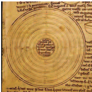
Labyrinthe Extrait des Carnets de Villard de Honnecourt BnF

Nous pouvons déjà convenir que cette voie particulière comporte autant de points de départ que d'hommes, autant de chemins que de voies d'élévation et de quêtes.